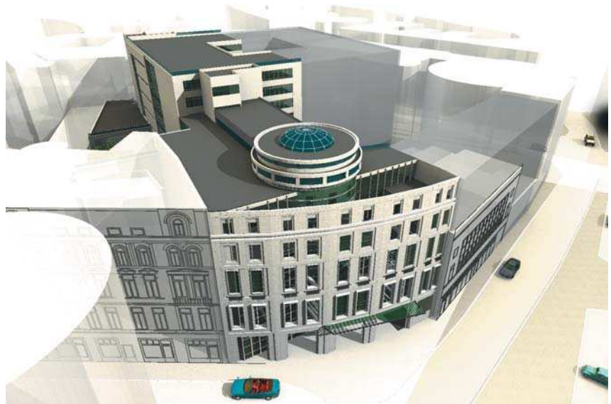
Galeriile Blanduziei, str. Doamnei, perspectivă, fațadă

Arhitectura prin funcțiunea ei de a ordona spațiul dă o anume identitate lumii în evoluția sa