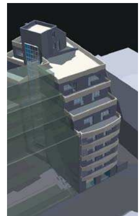
Bloc str. Ionel Perlea