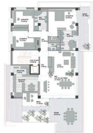
Imobil str. Uruguay, vederi exterior, interior, plan parter