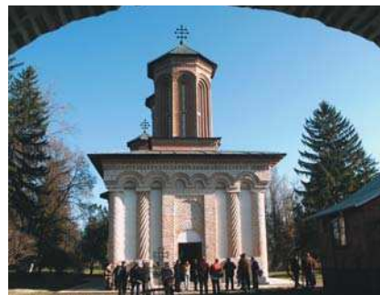
Biserica mănăstirii Snagov