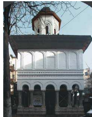
Biserica Doamnei, București