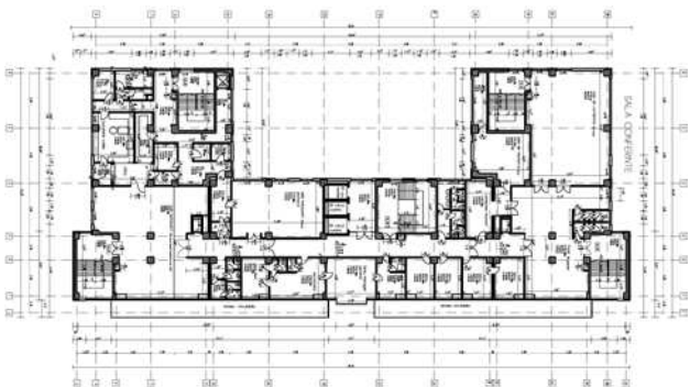
Policlinică Splai, perspectivă, plan etaj 5