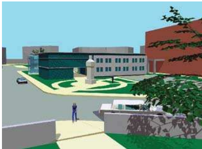
Amenajare Biserica Sf. Spiridon