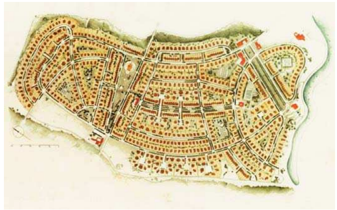
PUZ comuna Corbeanca, Ilfov

1975 arhitect diplomat al Institutului de Arhitectură „Ion Mincu” București