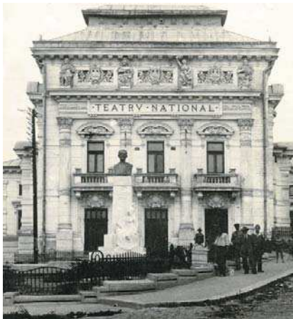
Teatrul Național Caracal, restaurare

1975 arhitect diplomat al Institutului de Arhitectură „Ion Mincu” București