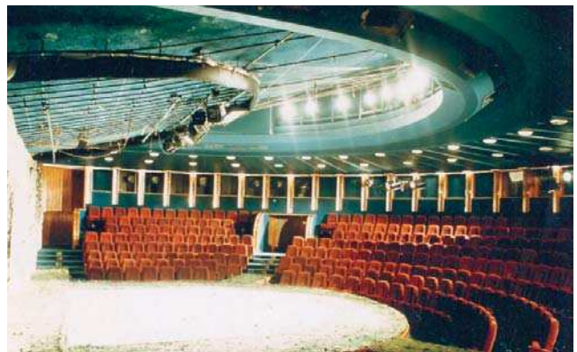
Teatrul Național București, sala Amfiteatru