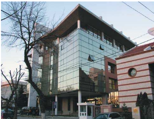
Centrul de afaceri Țiriac