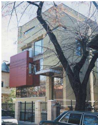
Imobil str. Balș vedere, fațadă, plan etaj