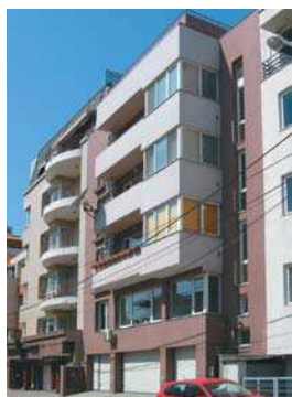
Imobil str. Uruguay, București

Sînt îngrijorată de calitatea arhitecturii pe care o producem în „stare de libertate”!