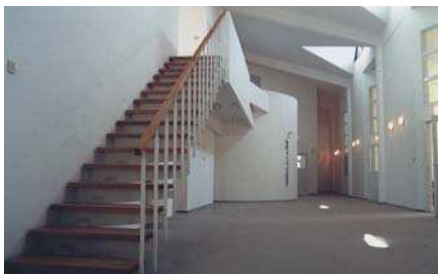
Orfelinat Călărași vederi