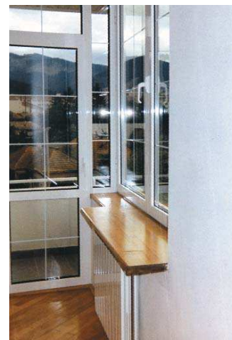
FOL Covasna exterior, interior