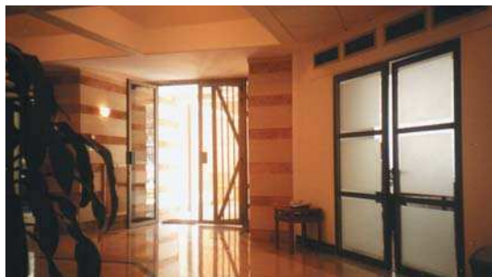
Reabilitare Ambasada României la Beirut