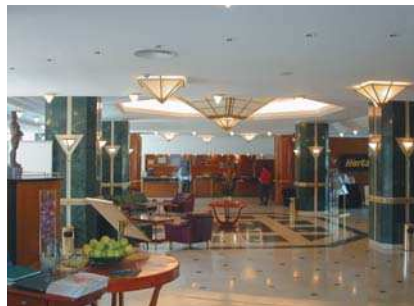
Hotel Crown Plaza București, reabilitare parter