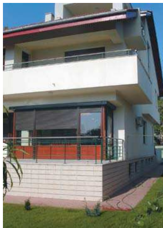
Vilă str. Someșul Rece, București plan parter, vedere