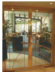
Reabilitare Hotel Intercontinental București plan parter, vederi interior