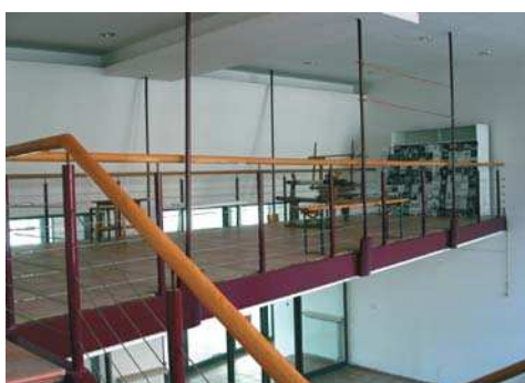
Consolidare, reamenajare Muzeul Țăranului Român București - Corp A, plan, vedere interior

Institutul de arhitectură „Ion Mincu” București, 1970-1976