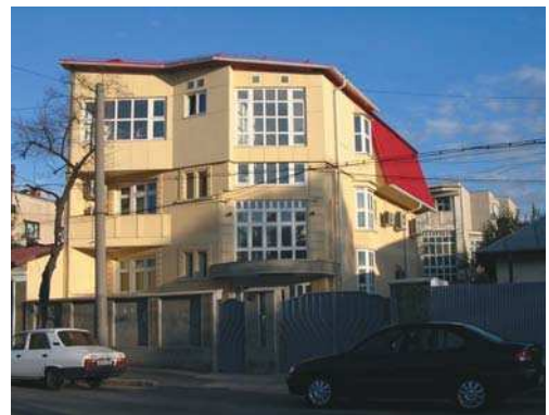
Imobil birouri str. Vaselor