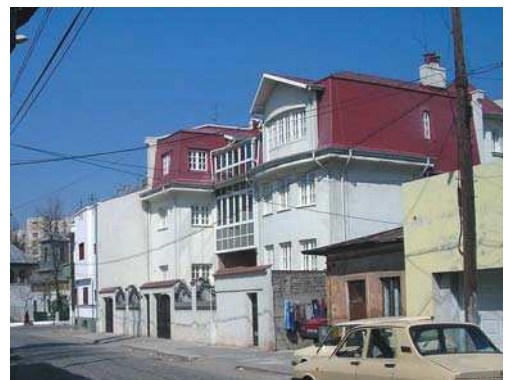
Imobil locuințe str. Sirenelor