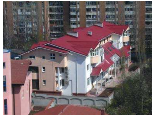
Imobil locuințe str. Prisca

1983 – Mențiune - Ansamblul Industrial „Laminorul de semifabricate” – C.S. Galați