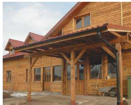
Centrul de terapie socială Pantelimon