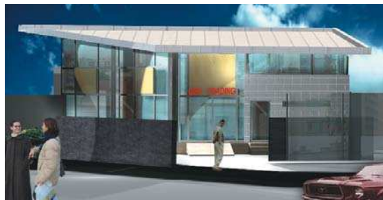
Showroom în Bd. Aerogării

- Locuințe pentru tineret în cartierul Drumul Taberei - concurs național ANL-MLPTL