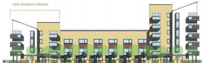
Ansamblul Grahaeme Park, ansamblu, perspective, fațade