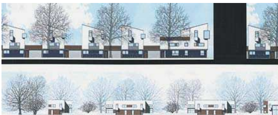
Concurs Straelen Housing, perspectivă, fațade