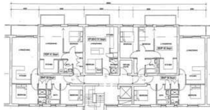
Ansamblul Leamouth, machetă, plan