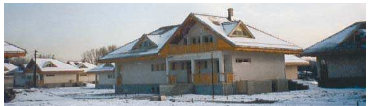
SOS Kinderdorf Internațional, București