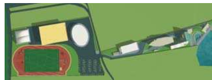
Extindere Centru Olimpic Sydney 2000, perspectivă, plan situație

Institutul de Arhitectură „Ion Mincu” 1987 - doctor în arhitectură 1999 U.A.U.I.M. / Universitatea tehnică din Eindhoven, Olanda