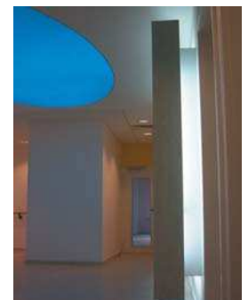
Centrul Nouveau, București, vederi exterior, interior