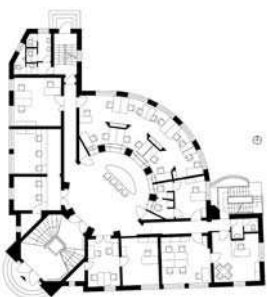
Administrația Financiară sector 6, București exterior, interior, plan parter