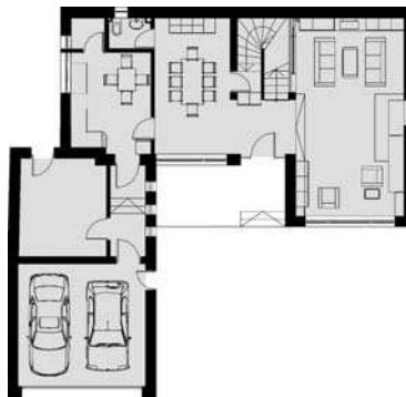
Locuință unifamilială Militari interior, plan parter

din 2003 arhitect stagiar în cadrul firmei „N.H.N. Studio”.