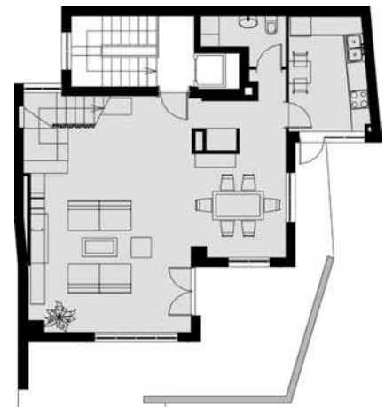
Amenajare duplex Militari interior, plan