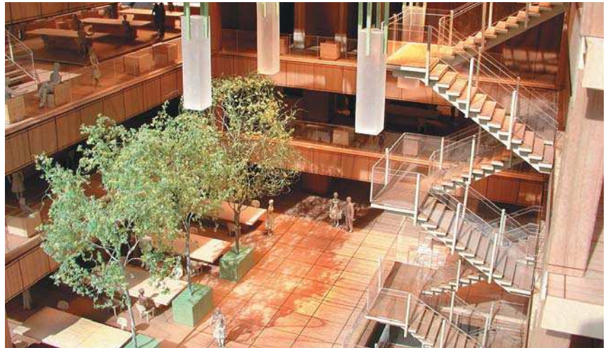
Biblioteca Universității Colgate, Hamilton, New York, SUA