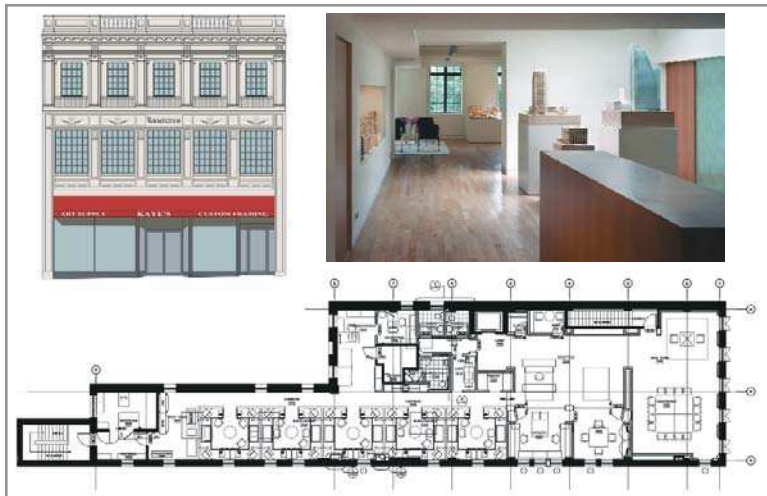
Office 980, Chapel st., New Haven, Connecticut, SUA