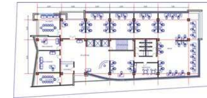
Imobil 2 str. Caranfil perspectivă, plan etaj curent