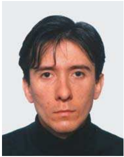
Alexandru SÂRBU 1663