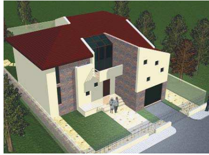
Casa Mihai, Mogoșoia, perspectivă, plan parter