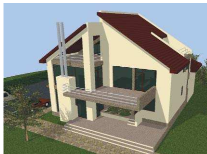
Casa Vergelea, Râșuceni, perspectivă, plan parter