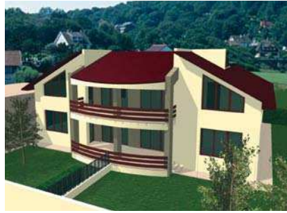
Casa Vladu, Diaconeasa, Chiajna perspectivă, plan parter