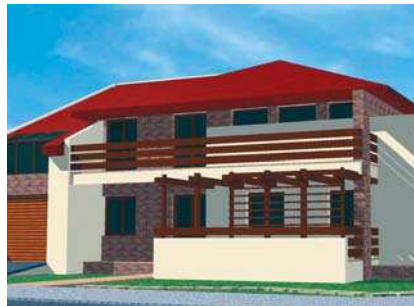
Casa Stoican, perspectivă, plan parter

Principalele activități și responsabilități: șef proiecte (coordonarea specialităților), implicarea în conceperea strategiilor de dezvoltare ale firmei, proiectare completă toate fazele (PAC, PT, DDE), inclusiv conceperea partiurilor de arhitectură, urmărire de șantier, întâlniri cu beneficiarii.