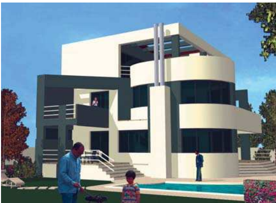
Casa Vintilă, Popești-Leordeni, perspectivă, plan parter