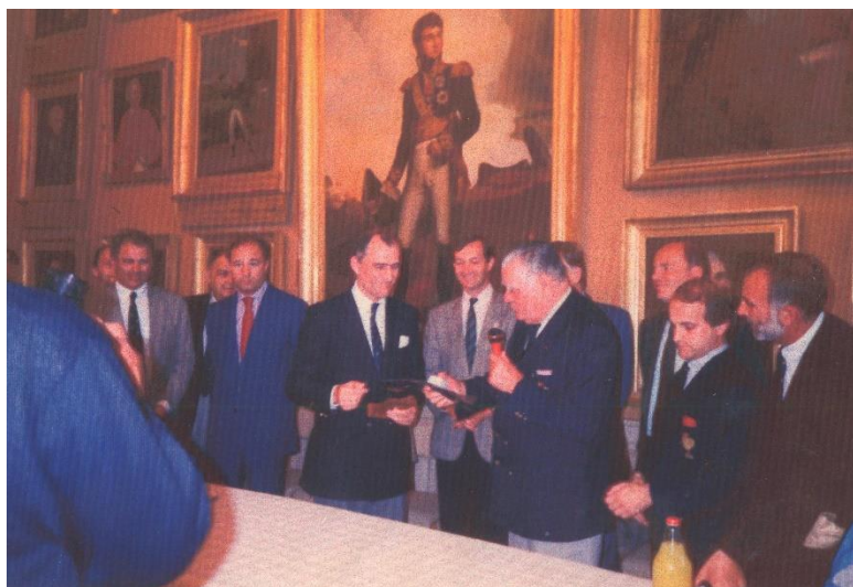
🏉 1990 La Sediul Federatiei Franceze de Rugby