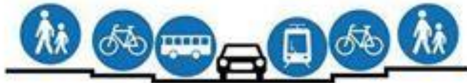
How cities should be designed