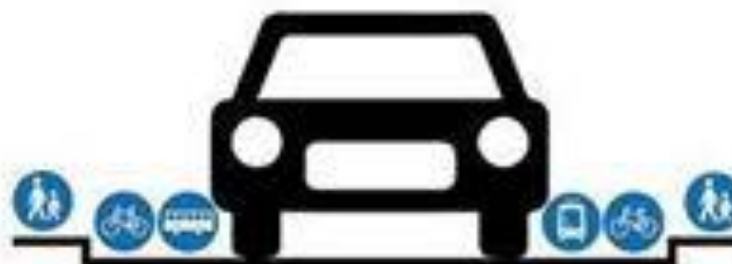
How most traffic engineers see your city