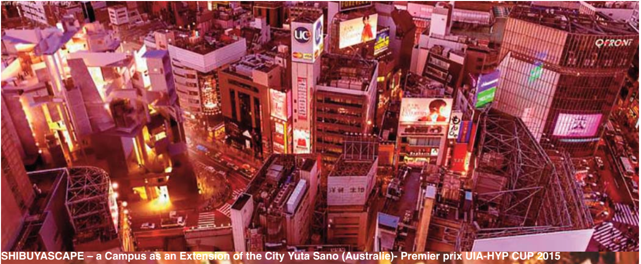
SHIBUYASCAPE – a Campus as an Extension of the City Yuta Sano (Australie)- Premier prix UIA-HYP CUP 2015