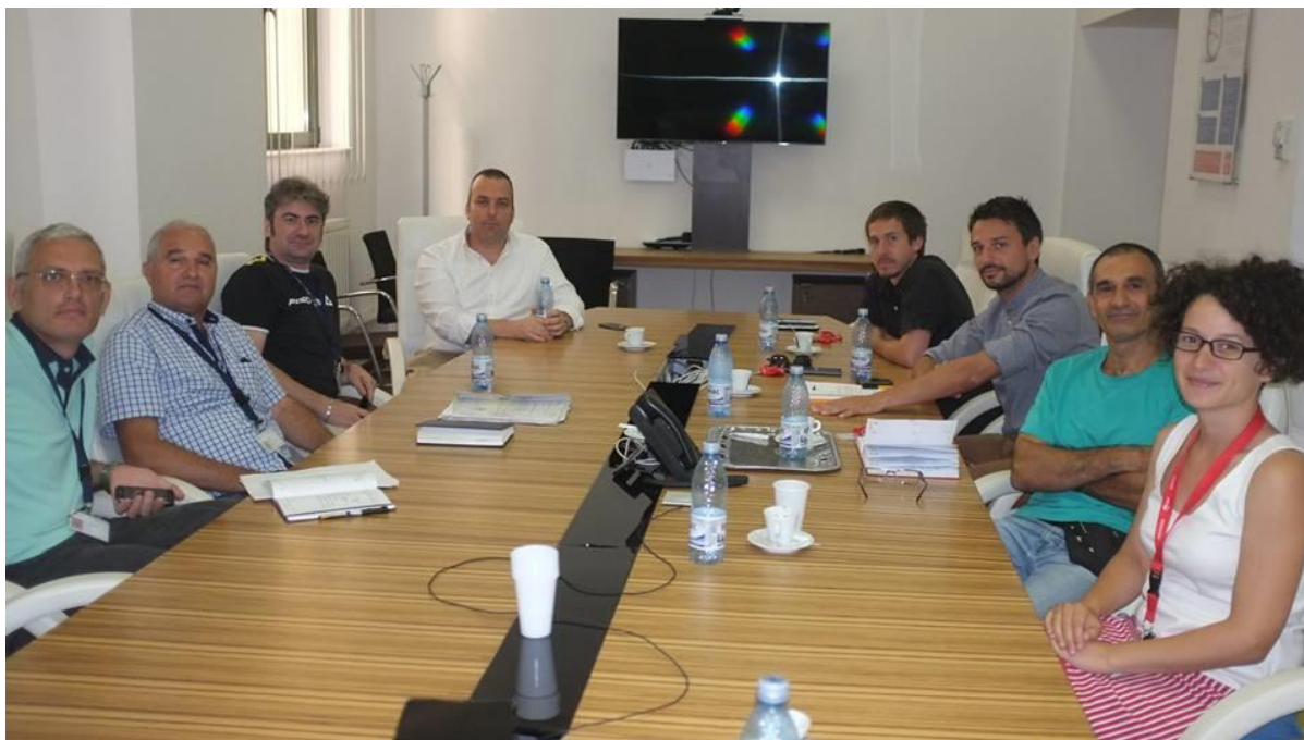
Foto: intalnire la sediul Enel ca urmare a petiției echipei Incotroceni

Raspunsul oficial si semnat de catre reprezentantii Enel este atasat ca anexa la acest raport.