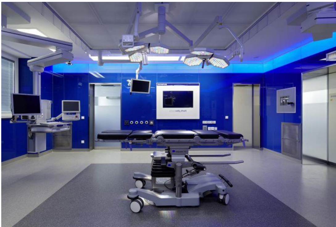
Foto: Marien Hospital, Marl, North Rhine-Westphalia, Germany © HDR | TMK Planungsgesellschaft mbH

"Ordinul Arhitecților din România este organizația care reglementează, gestionează și reprezintă profesia de arhitect în România, fiind abilitat prin lege în acest sens. Ordinul cuprinde toți arhitecții cu drept de semnătură din România, pe cei care activează temporar în România, precum și stagiarii sau alți arhitecți care sunt implicați în administrații, educație sau lucrează în diferite birouri sau instituții. Ordinul Arhitecților activează ca un generator de proiecte și partener pentru cei care sunt interesați și pot contribui la dezvoltarea culturii mediului construit, pentru o calitate a vieții mai bună în România".