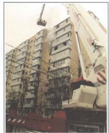
Incendiu la o construcție reabilitată termic, Lacul Tei, Bucuresti 2014

Vă rugăm să desemnați persoanele interesate în urmărirea desfășurării acestui eveniment și să confirmați participarea Dvs. la numărul de telefon +40757 029 177 sau la adresa de email: incdincercfoc@yahoo.com .