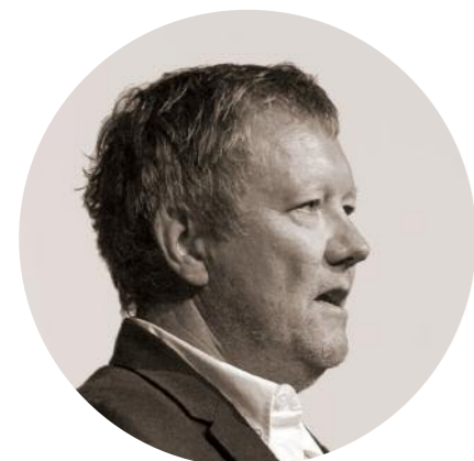
Interviu cu KJETIL TRÆDAL THORSEN

CONTINUĂM SERIA DE ARTICOLE DEDICATE celui de-al 25-lea Congres UIA, organizat în Durban, Africa de Sud. Arhitecți, designeri, urbaniști, activiști, cercetători, studenți și factori de decizie din toate colțurile lumii au dezbătut, timp de cinci zile, strategii pentru orașe mai locuibile, mai funcționale și mai frumoase. Dintre personalitățile arhitecturii contemporane invitate să vorbească în fața publicului am avut plăcerea să stăm de vorbă cu Kjetil Trædal Thorsen, directorul biroului Snøhetta, și celebrul Toyo Ito, laureat al Premiului Pritzker în 2013.