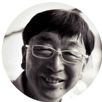
Interviu cu TOYO ITO

Practica academică, și nu numai aceasta, utilizează în mod curent, în sprijinul diverselor teze de specialitate, exemple de notorietate, care au rolul de a da legitimitate discursurilor și referințe solide, de netăgăduit. Oricare ar fi domeniul la care ne referim, acesta își are părinții în persoana unor celebriități care, prin aportul lor, mai mult sau mai puțin apropiat de zilele noastre, au contribuit în mod esențial la dezvoltarea disciplinei în care au activat. Iar specialiștii disciplinei respective irosesc rar ocaziile de a-i cita în demersuri ulterioare, sporindu-le astfel reputația. Rar găsim studii de filosofie care să nu pomenească numele lui Aristotel, Platon, Socrate, Hegel, Nietzsche ori Heidegger, precum la fel de rare sunt cercetările istorice în care să nu fie menționați Herodot, Ptolemeu sau Schliemann. Medicina îl are în această categorie pe Hippocrate, artele frumoase pe Michelangelo, Rafael și Leonardo, estetica pe Hartmann și, mai recent, pe Eco, istoria religiilor pe Eliade etc.. Simpla enumerare a acestor nume este deja o sarcină imposibilă și care, în plus, ar face o mare nedreptate tuturor celor omiși. Ce reținem ca fiind cert este că orice domeniu de activitate și-a creat și se poate lăuda cu propria panoplie de nume și personalități, fie ale veacurilor trecute, fie contemporane, a căror activitate capătă, prin importanța sa intrinsecă, rangul