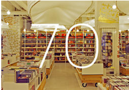
Exhibit Arhitectura: De la gesturi tari, la bricolaj

The contemporary music venue at Nîmes Métropole brings the physical and symbolic tensions together to produce a variable character.