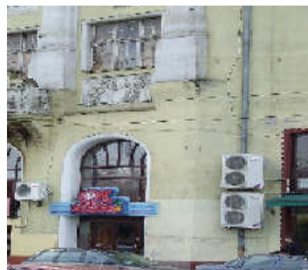
Elemente parazitare, amplasate incorent în locuri inadecvate