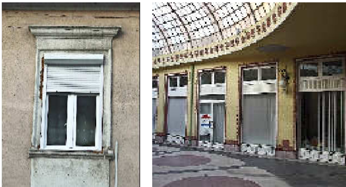
Înlocuiri neadecvate de de tâmplării