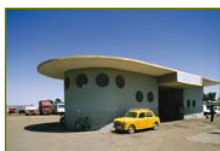
Station service Shell