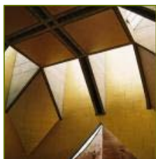
Eglise de Bergamo Mario Botta, archi- tecte