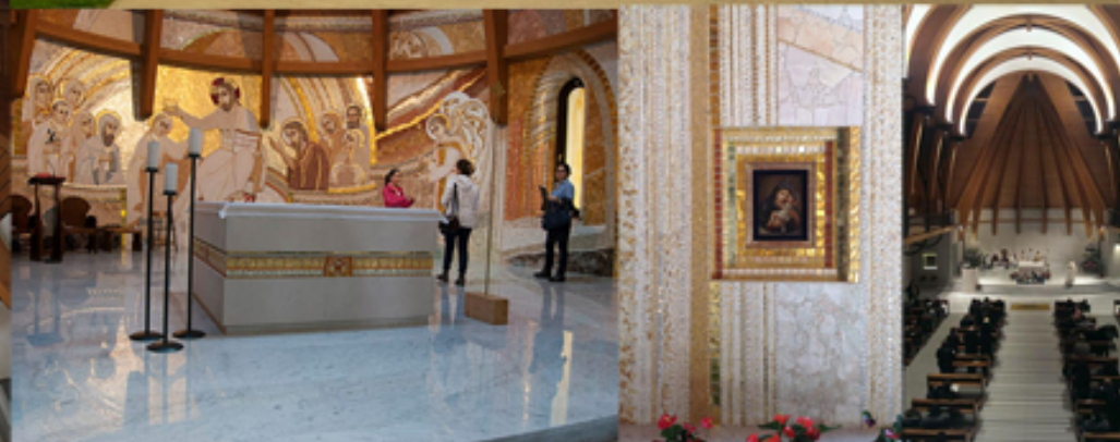
Complexul Monahal Snagov al Ordinului Carmelitanilor Desculti, Snagov , 2001 - 2014