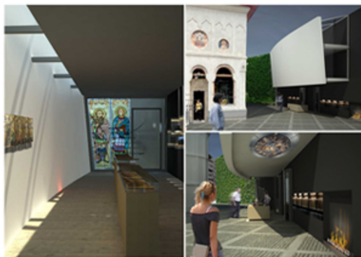
biserica Olari - Muzeul icoanelor (propunere), Bucuresti