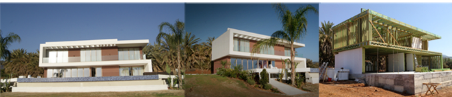
locuinta unifamiliala, Cipru, 2013-2014