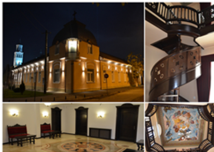
Centrul Eparhial al Episcopiei Devei si Hunedoarei (extindere si renovare)