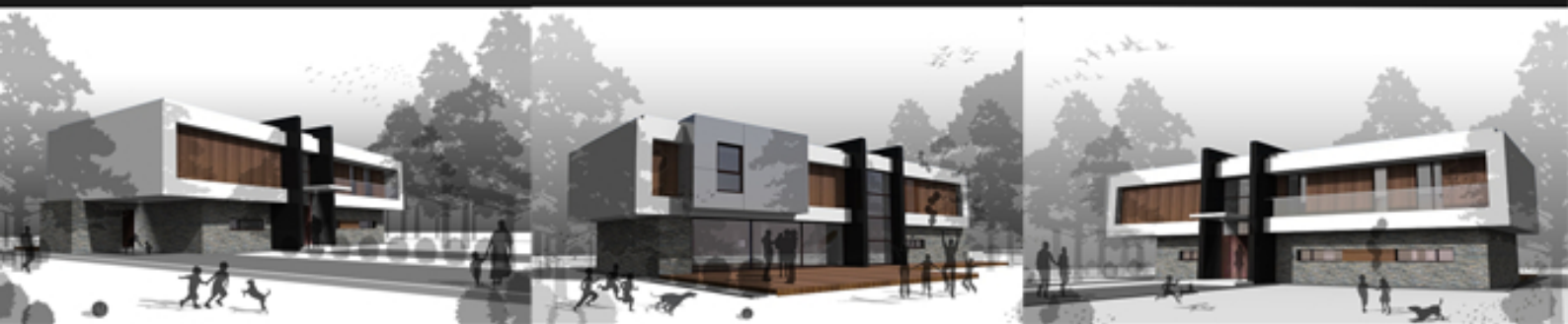
locuinta unifamiliala, Baneasa, 2014-2015, santier in lucru