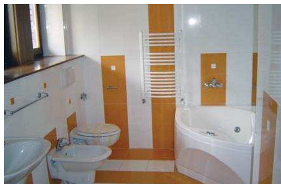
Locuințe Șoseaua Nordului, vederi exterior, interior