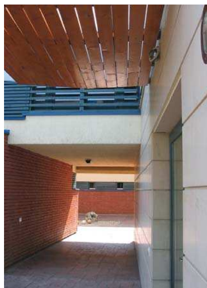
Orfelinat, vederi exterior, interior, plan parter