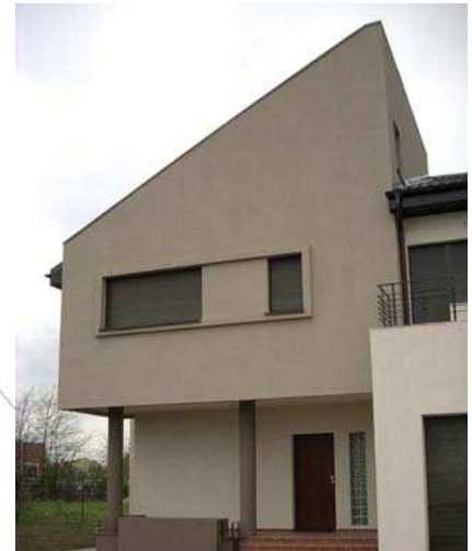
Imobil Băneasa, vederi exterior, interior, plan parter

1972 - 1978 - Institutul de Arhitectură "Ion Mincu"