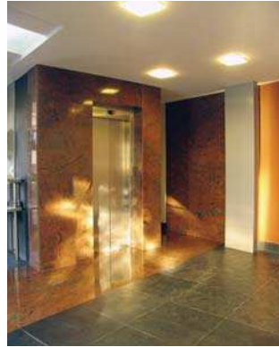
Imobil str. Zborului, vederi interior, exterior, plan parter