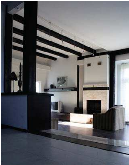
Vilă la Breaza, vederi exterior, interior