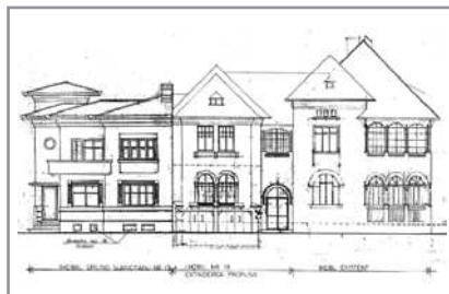
Imobil str. Slăniceanu, București fațadă, plan parter