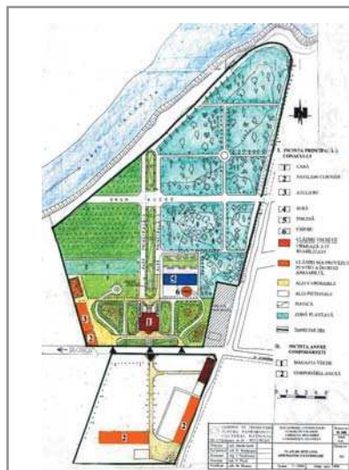
Conacul și parcul Bolomey, Cosâmbești, Ialomița plan situație, vedere înainte de restaurare, secțiune