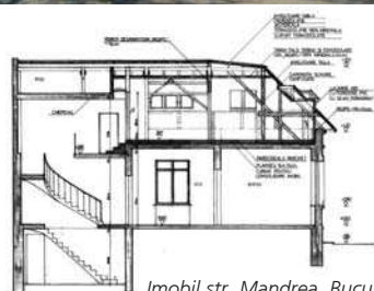
Imobil str. Mandrea, București vedere, secțiune