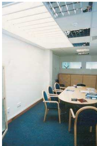
Birouri service auto Volvo vederi interior

... Îmi place să lucrez direct cu clienții în procesul de proiectare de arhitectură și e o mare satisfacție să vezi că le-ai realizat visul, pe care s-au străduit să ți-l descrie cu vorbe, schițe stângace, fotografii. Fără să absolutizez funcționalismul în arhitectură, îmi place să croiesc spațiu pentru OAMENI.