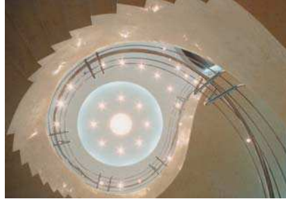
Amenajare interioară sediu Romtelecom Ploiești, vederi