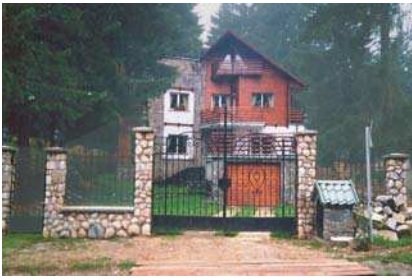
Vila Gilda, Predeal vedere, plan parter