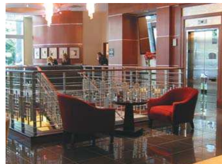
Hotel Marriott Chicago, Illinois, SUA, fațada principală, interior lobby