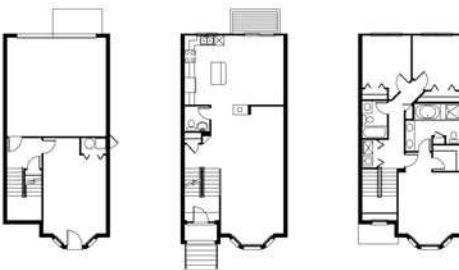
Ansamblu rezidențial Prescott Woods Naperville, Illinois, SUA, fațada principală, planuri unitate rezidențială