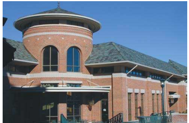
Clădire comercială: Whole Foods Deerfield, Illinois, SUA