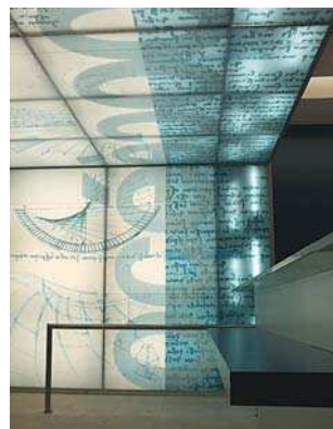
Sediu Eurocom, vederi interior