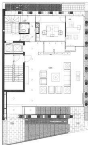
Hotel Stil, vedere, plan parter

1981-1987 Institutul de Arhitectură „Ion Mincu” București