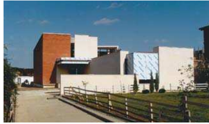
Casa Danciu vedere, plan parter

Dincolo de arhitectura pe care o facem, recunoaștem surprinși arhitectura care ne impresionează: fără a aparține unui anumit stil, curent, perioadă istorică (cu atât mai penetrantă cu cât „vine mai de departe”); o arhitectură vie apelează mereu, percepția, memoria, imaginația și rămâne, în afara timpului, o valoare care vibrează.