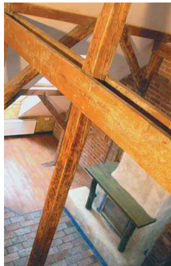
Amenajare atelier artist plastic, Cotroceni vederi, plan parter

Cred în arhitectură și urbanism ca o formă de respect atât față de sine cât și în relația cu restul colectivității fiind absolut necesară o autoritate care să vegheze asupra calității mediului construit. E vorba, pe de o parte de respectarea dreptului individual de expresie al celui care construiește, cât și, pe de altă parte, de asigurare a unor condiții de viață civilizate pentru toți membrii societății. Arhitectura pleacă de la nevoile fundamentale ale omului, de adăpost, odihnă și refacere cât și de la nevoia de afirmare și recunoaștere, devenind adesea purtătoarea unor valori spirituale. Înțeleg arhitectura ca pe o formă de comunicare. Imi place să văd orașele ca niște fresce ale societății umane, uriașe opere colective în care, printr-un continuu efort de auto-depășire, fiecare generație lasă câte puțin din sufletul ei.