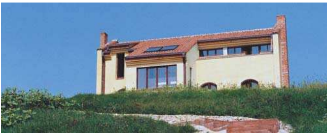
Casa de vacanță, Balotești, vederi, plan parter