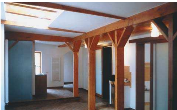
Amenajare mansardă parc Cișmigiu vedere, plan parter