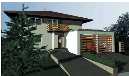
Casă, Stupini, Brașov