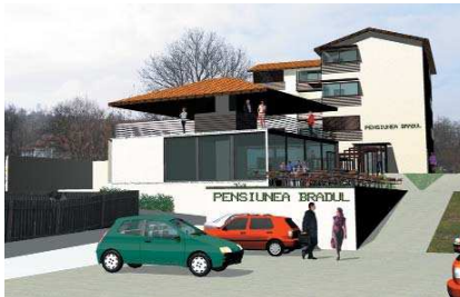
Pensiune, Moeciu, Brașov