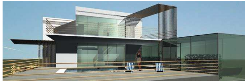
Vilă, Noua Zeelandă