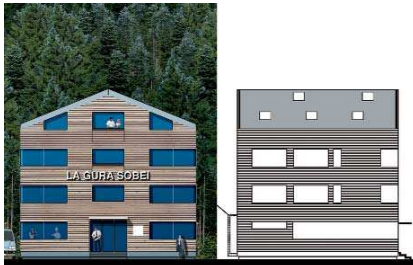
Hotel, Predeal, fațade

Standuri expoziționale Eurotextil, Predeal, Amann, DataS, Zarah Moden, Raum 2003-2006.