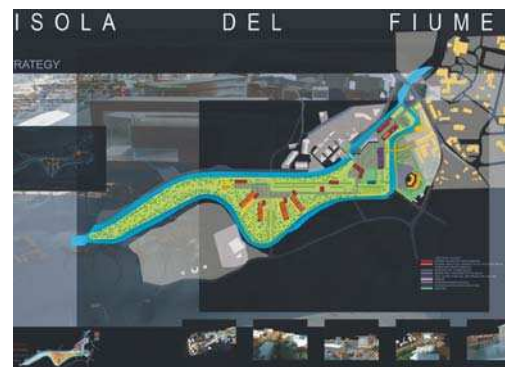
Reconversie, extindere oraș Isola del Fiume, Italia