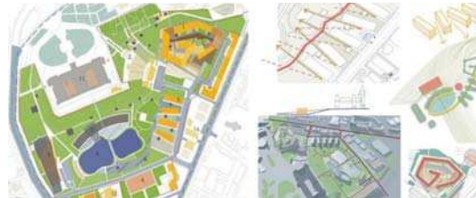
Reabilitare Centru Istoric Iași, perspective, plan