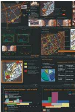
Proiect City Center, București