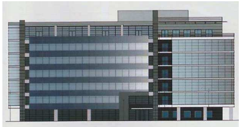
Centrul de Afaceri „Dorobanți”

Topografia operativă este cea latură a urbanismului înțeleasă ca mișcare strategică în sensul modelării ordonate a teritoriului.