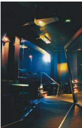
Bar „Future”, Constanța

Topografia operativă este cea latură a urbanismului înțeleasă ca mișcare strategică în sensul modelării ordonate a teritoriului.