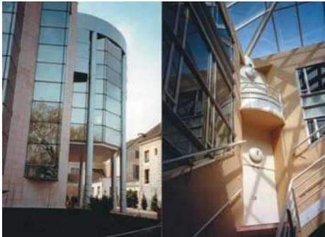
Pavilion Ambroise Paré, Hôpital de Joanne, Paris 1992.

Nu știu dacă Ordinul are o Strategie, studiată și logică, privind orașul București. Uneori membri marcanți pot face figură proastă, trimitând soluția în direcții ignorate de ei. „Ceea ce nu cunoști nu are nici-un defect.” Propunere a unor ținte de Atins.