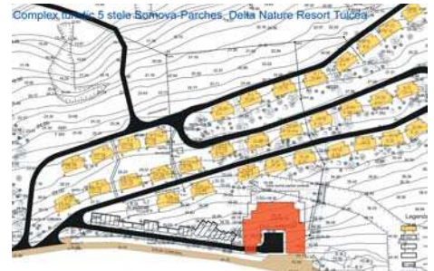
Complex turistic 5 stele Somova-Parches, Delta Nature Resort Tulcea

Graduated 1968 - Bucharest Highschool of Architecture