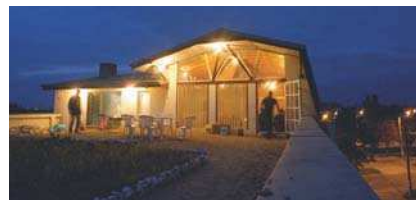
Sediul firmă str. I. Maniu, București 1992

1975-91 EUP; Design Institute Investments Electric & Electronic Industry; coordinator for Electrotechnic Platform Bistrița, /Ceramic Insulators factory