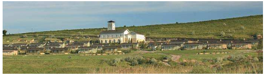
Complex turistic 5 stele Somova, Tulcea, vedere, plan ansamblu

Unii arhitecții au făcut toată viața silozuri. Vedem acum și hoteluri ce aduc a silozuri. Alții au făcut locuințe cu confort scăzut. Și toate lucrările lor noi sunt similare. Nu există nimic mai nereușit decât un proiect High-Tech, realizat cu tencuiele și tehnologii modeste. Există proiecte care semănau pe hârtie a Lamborghini, iar pe teren poți vedea o cutie din tablă peste cadre grosolane. Funcțiunea nu mai e interesantă, nici la Concursuri de Arhitectură. Concursurile cu Catedrala ar fi material bun de divertisment. Mai degrabă judecă poza obiectului. Personalitățile din juriu vor Manifeste de arhitectură. Mulți dintre noi mai avem de parcurs o cale bună, până când ne vom comporta Normal, ca niște adevărați Europeni.