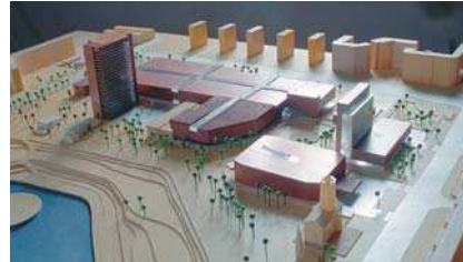
Macheta centru Titan – concurs 2000