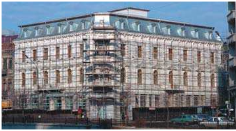
Reconversie Clădire 120 ani Rahova vedere șantier, plan parter