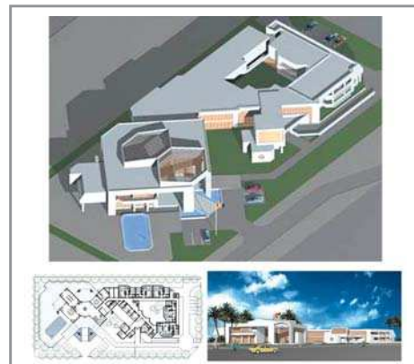
Ambasada României în Maroc, Rabat perspective, plan parter