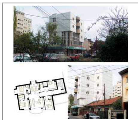
Imobil str. Tudor Vianu, București vederi, plan etaj 3-4