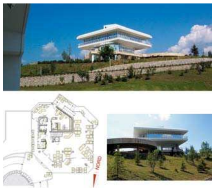
Casa Clubului - vederi și plan parter