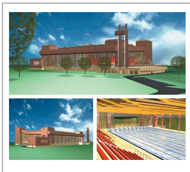
Piscină olimpică, parc BNR, București

Arhitectura este un act de creație artistică care compune cu volume neexistente în natură și care utilizează estetic și logic structuri cărora le dă viață, armonizând noțiunea frumosului cu noțiunea utilului, atât la nivelul edificiilor cât și la nivelul macro structurilor urbanistice.