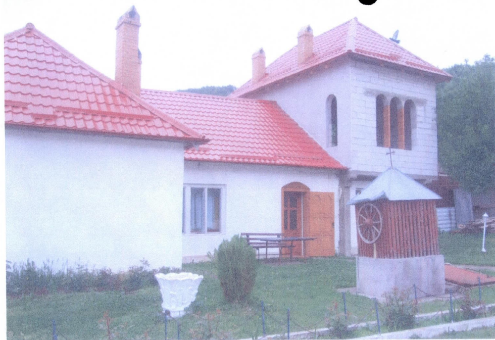
CLĂDIRE CHILII + CONAC EPISCOP