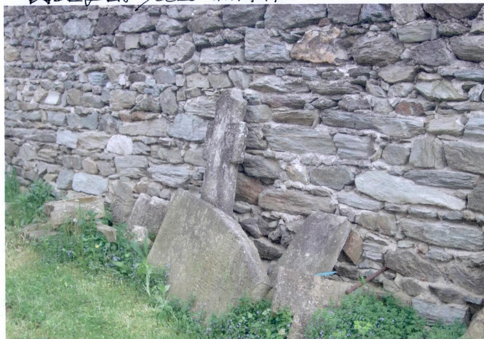
▲ DETALIU ÎNFRUMURII