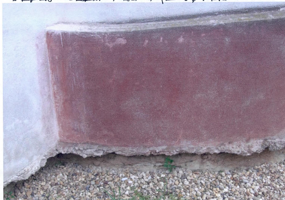
▲ DETALIU SOTUL BISERICII