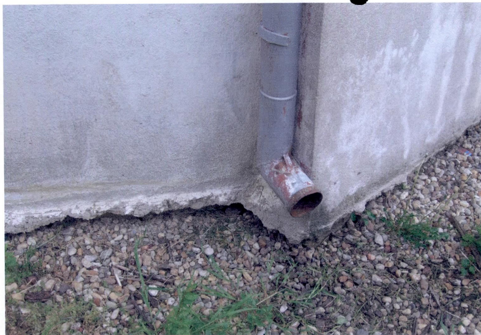
▲ DETALIU SOTUL BISERICII