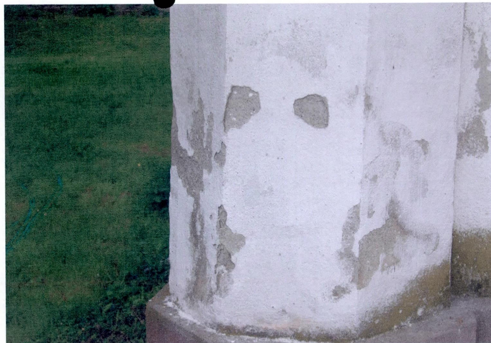
DETALIU COLONIEI ANGUSTATE BISERICII